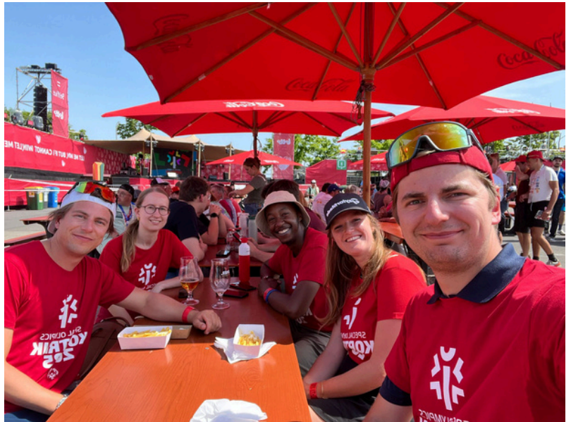
Rotaract Tervuren in actie tijdens de Nationale Zomerspelen van de Special Olympics Belgium in Kortrijk.

Deze goede samenwerking creëert een hechte groep waardoor er mooie vriendschappen ontstaan. Dit is positief voor de werking van alle clubs.