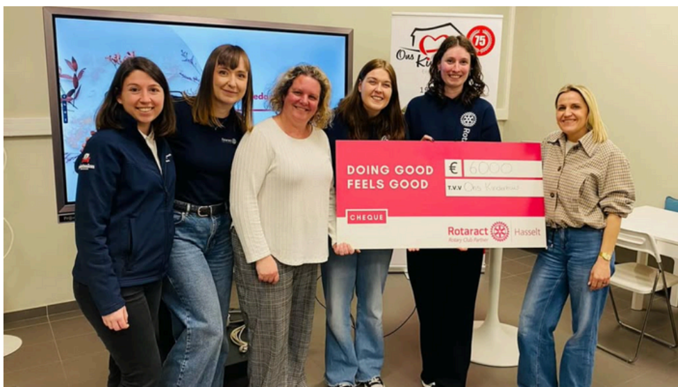
Rotaract Hasselt doneert meer dan 6000 euro aan middelen en geld.

Door samen te werken, elkaar te inspireren en te steunen, bouwen we stap voor stap aan een warmere en meer verbonden wereld.