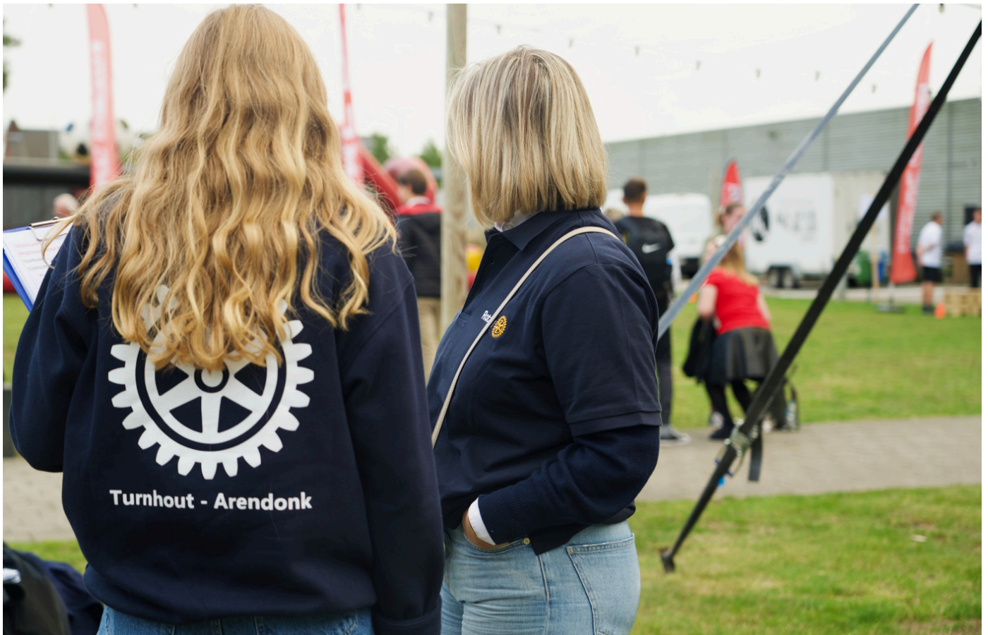
Rotaract Turnhout in actie tijdens een georganiseerde benefiet voor Moved to Help.

Onze sociale projecten bestaan uit organisaties die wij jaarlijks of actie gebaseerd steunen. Onze projecten zijn hands-on : van fondsenwervende events en sociale acties tot concrete hulp bij lokale initiatieven. We steken niet alleen de handen uit de mouwen, we doen, ondernemen en verbinden .