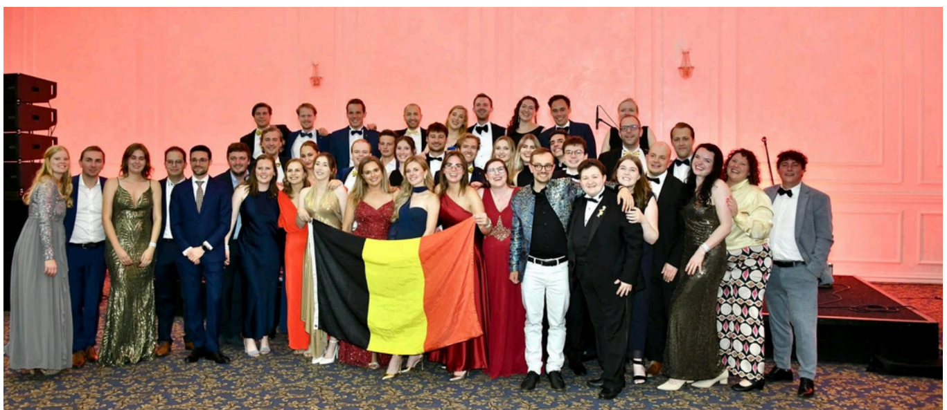
Meer dan 42 Rotaracters van District 2130 en 2140 aanwezig op REM Skopje.

Sluit je aan bij Rotaract en word deel van een wereldwijd netwerk dat écht het verschil maakt!